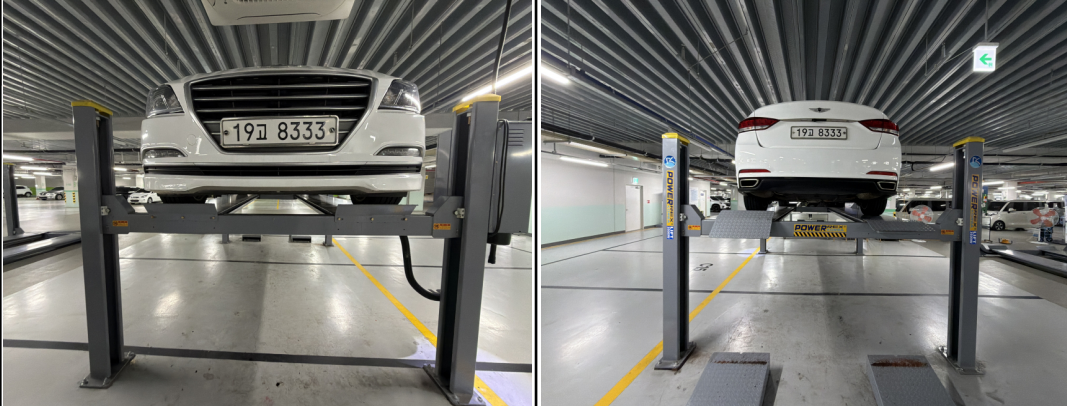
점검 장면 촬영 사진 [6517120635]

※ "가격조사·산정"은 소비자가 매매계약을 체결함에 있어 중고차 가격의 적절성 판단에 참고할 수 있도록 법령에 의한 절차와 기준에 따라 전문 가격조사·산정인이 객관적으로 제시한 가액입니다. 따라서 "가격조사·산정"은 소비자의 자율적 선택에 따른 서비스이며, 가격조사·산정 결과는 중고차 가격판단에 관하여 법적 구속력은 없고 소비자의 구매여부 결정에 참고 자료로 활용됩니다.