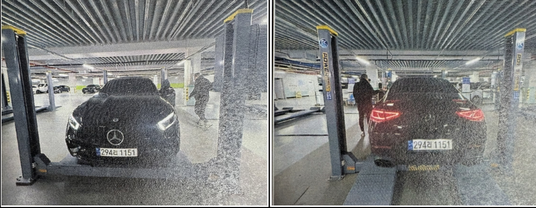
점검 장면 촬영 사진 [6517120084]

※ "가격조사·산정"은 소비자가 매매계약을 체결함에 있어 중고차 가격의 적절성 판단에 참고할 수 있도록 법령에 의한 절차와 기준에 따라 전문 가격조사·산정인이 객관적으로 제시한 가액입니다. 따라서 "가격조사·산정"은 소비자의 자율적 선택에 따른 서비스이며, 가격조사·산정 결과는 중고차 가격판단에 관하여 법적 구속력은 없고 소비자의 구매여부 결정에 참고 자료로 활용됩니다.