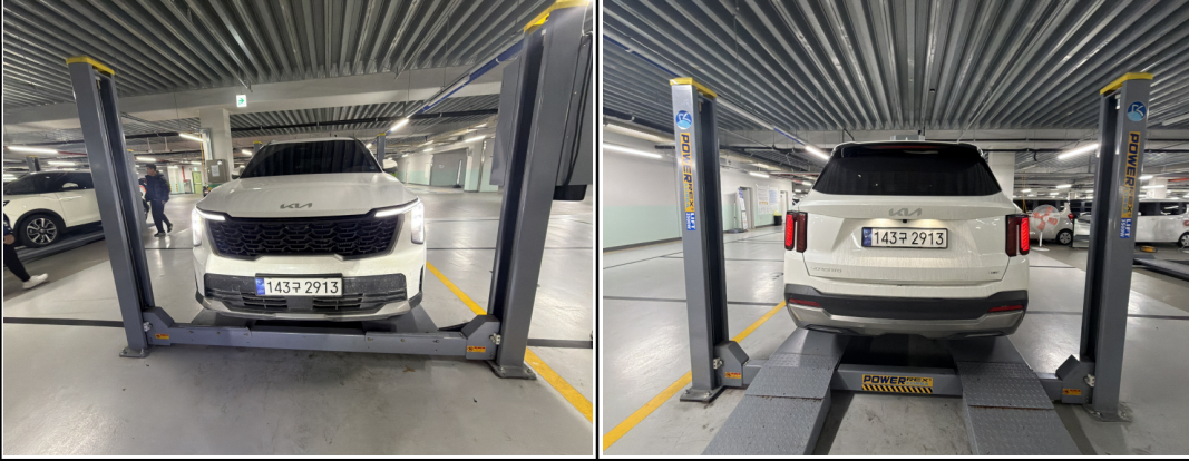
점검 장면 촬영 사진 [6517118709]

※ "가격조사·산정"은 소비자가 매매계약을 체결함에 있어 중고차 가격의 적절성 판단에 참고할 수 있도록 법령에 의한 절차와 기준에 따라 전문 가격조사·산정인이 객관적으로 제시한 가액입니다. 따라서 "가격조사·산정"은 소비자의 자율적 선택에 따른 서비스이며, 가격조사·산정 결과는 중고차 가격판단에 관하여 법적 구속력은 없고 소비자의 구매여부 결정에 참고 자료로 활용됩니다.