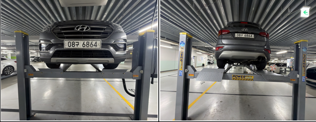
점검 장면 촬영 사진 [6517118539]

※ "가격조사·산정"은 소비자가 매매계약을 체결함에 있어 중고차 가격의 적절성 판단에 참고할 수 있도록 법령에 의한 절차와 기준에 따라 전문 가격조사·산정인이 객관적으로 제시한 가액입니다. 따라서 "가격조사·산정"은 소비자의 자율적 선택에 따른 서비스이며, 가격조사·산정 결과는 중고차 가격판단에 관하여 법적 구속력은 없고 소비자의 구매여부 결정에 참고 자료로 활용됩니다.