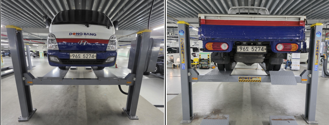
점검 장면 촬영 사진 [6517118303]

※ "가격조사·산정"은 소비자가 매매계약을 체결함에 있어 중고차 가격의 적절성 판단에 참고할 수 있도록 법령에 의한 절차와 기준에 따라 전문 가격조사·산정인이 객관적으로 제시한 가액입니다. 따라서 "가격조사·산정"은 소비자의 자율적 선택에 따른 서비스이며, 가격조사·산정 결과는 중고차 가격판단에 관하여 법적 구속력은 없고 소비자의 구매여부 결정에 참고 자료로 활용됩니다.