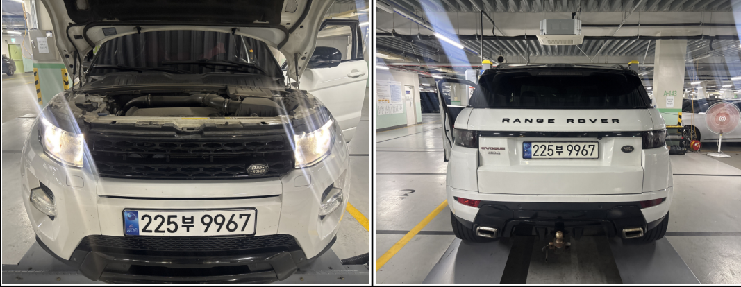
점검 장면 촬영 사진 [6517113622]

※ "가격조사·산정"은 소비자가 매매계약을 체결함에 있어 중고차 가격의 적절성 판단에 참고할 수 있도록 법령에 의한 절차와 기준에 따라 전문 가격조사·산정인이 객관적으로 제시한 가액입니다. 따라서 "가격조사·산정"은 소비자의 자율적 선택에 따른 서비스이며, 가격조사·산정 결과는 중고차 가격판단에 관하여 법적 구속력은 없고 소비자의 구매여부 결정에 참고 자료로 활용됩니다.