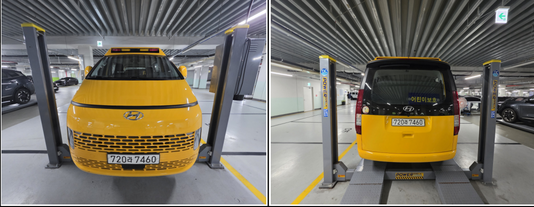
점검 장면 촬영 사진 [6517113155]

※ "가격조사·산정"은 소비자가 매매계약을 체결함에 있어 중고차 가격의 적절성 판단에 참고할 수 있도록 법령에 의한 절차와 기준에 따라 전문 가격조사·산정인이 객관적으로 제시한 가액입니다. 따라서 "가격조사·산정"은 소비자의 자율적 선택에 따른 서비스이며, 가격조사·산정 결과는 중고차 가격판단에 관하여 법적 구속력은 없고 소비자의 구매여부 결정에 참고 자료로 활용됩니다.